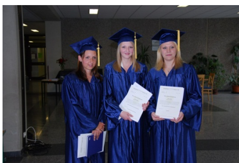
RDP-Feier 2010 in der Aula