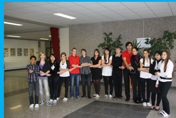
Schüler/innen der BHAK/BHAS in der Aula