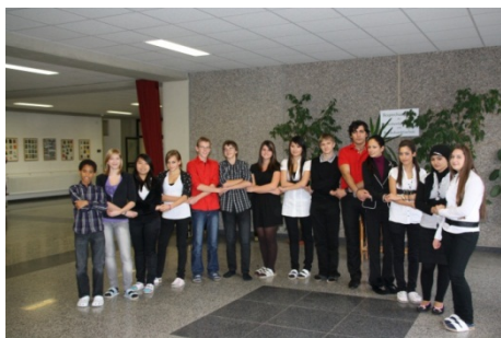
Schüler/innen der BHAK/BHAS Bruck/Leitha in der Aula