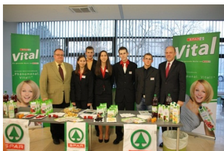
Projektpräsentation in der WK Schwechat