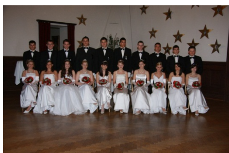
Schulball 2010 im Schloss Margarethen/Moos