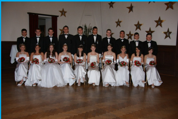
Schulball 2010 im Schloss Margarethen/Moos