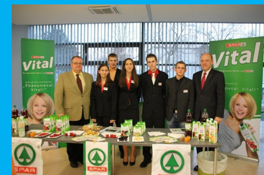
Projektpräsentationen in der WK Schwechat