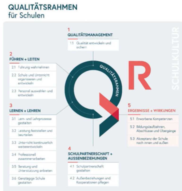
Abb. 1: Der Qualitätsrahmen für Schulen.

Der QR umfasst fünf Qualitätsdimensionen, von denen die ersten vier auf Prozesse abzielen und die fünfte auf Ergebnisse und Wirkungen der schulischen Arbeit fokussiert (s. Abb. 1).